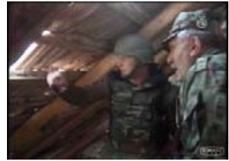
Blagoje Adžić u poseti Vukovaru, oktobar 1991

Primetno je da, što se tiče Pakračkog incidenta, Politika i Politika ekspres ograničavaju svoje izvore na jednu stranu, Borba nastoji da izveštava balansirano, ukrštajući informacije iz Predsedništva SFRJ, vojske, srpskih i hrvatskih vlasti (Borba, 4.3.1991 i 5.3.1991). Neprofesionalno, zapaljivo i konfuzno izveštavanje o neredima u Pakracu dostiže vrhunac u Večernjim novostima. One na naslovnici od 3.3.1991 donose ogroman naslov „ Prepad na Pakrac “ (str.1) u kojem se kaže da zvanično niko nije poginuo, ali da se nezvanično